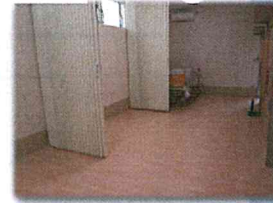
▲短期入所ルーム(2階)